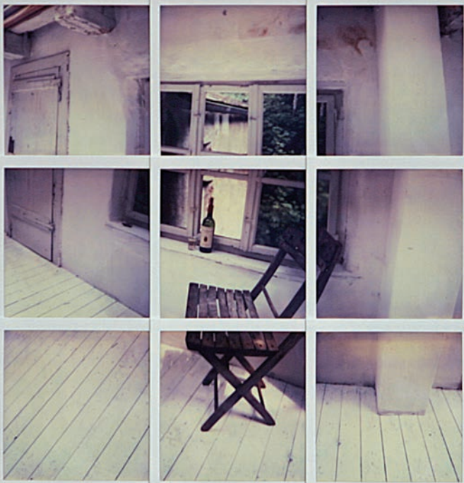
Vormittags im Atelier